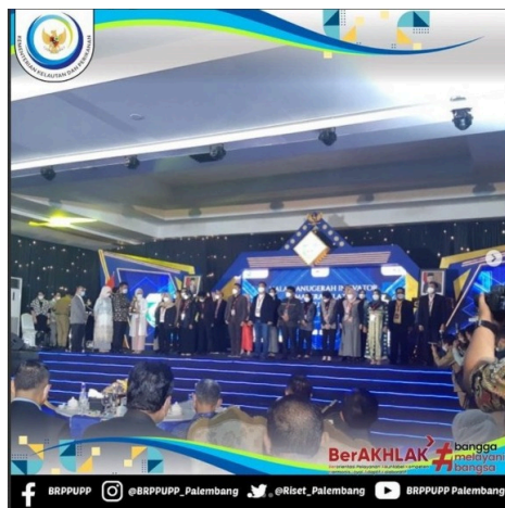
Senin (20/12/21), Dalam Hari Kebangkitan Teknologi Nasional ke 26 Provinsi Sumatera Selatan telah melakukan seleksi Penerimaan Penghargaan Inovator Sumatera Selatan tahun 2021 dengan 17 kategori yang diberikan langsung dari Bapak Gubernur Sumsel.