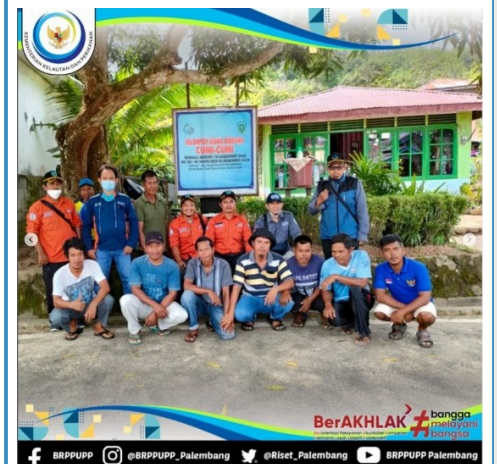
Penyuluh Perikanan Satminkal BRPPUPP bersama Dinas Perikanan Kabupaten Belitung lakukan pembinaan terhadap 3 KUB (Kelompok Usaha Bersama), verifikasi calon penerima bantuan mesin kapal serta calon penerima kapal fiber pada Kampung Nelayan Maju Desa Suak Gual, Kecamatan Selat Nasik, Kabupaten Belitung.

Beberapa masukan dan saran terkait pengembangan tracking mangrove pun telah disampaikan kepada Pokdarwis Pagal Piling (02/03/2022).